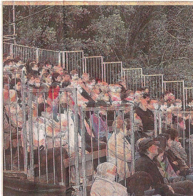
Les spectateurs ont été subjugués.